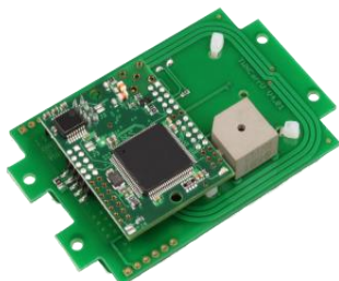
TWN4 OEM PCB Vista dal basso

*Precedentemente conosciuto come TWN4 MIFARE NFC