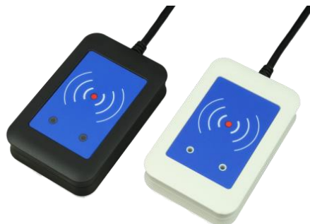
Desktop Vista dall'alto

La famiglia di apparecchi di lettura e scrittura di transponder TWN4 permette agli utenti di leggere e scrivere quasi tutti i tag e/o le etichette da 125kHz / 134.2kHz e 13.56MHz – tali apparecchi sono compatibili con la maggior parte dei transponder di vari fornitori, come ATMEL, EM, ST, NXP, TI, HID, LEGIC, etc. e con gli standard ISO, come gli standard ISO14443A (T=CL), ISO14443B (T=CL), ISO15693, ISO18092 / ECMA-340 (NFC).